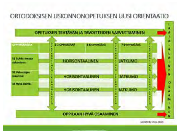
Kuva 2. Oppimäärien muodostamisen vertikaalinen ja horisontaalinen rakenne ortodoksisen uskonnonopetuksen eri sisältöalueissa.