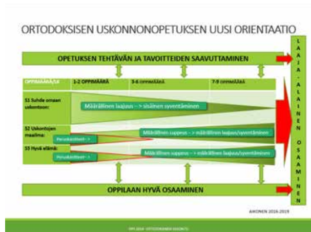
Kuva 1. Oppimäärien painotus perusasteen ortodoksisen uskonnonopetuksen eri sisältöalueissa.