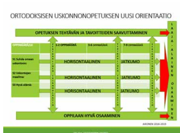
Kuva 2. Oppimäärien muodostamisen vertikaalinen ja horisontaalinen rakenne ortodoksisen uskonnonopetuksen eri sisältöalueissa.